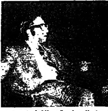
سفير المغرب السيد ابراهيم بنون

بلقا، ويتبع بقية جريات الامور على الصعيد الداخلي والاقليمي في لبنان، ويشترك الملك في هذا الاحتفال الشعب المغربي بكلمة.